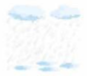
cloud and rain